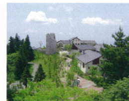
六甲ガーデンテラス