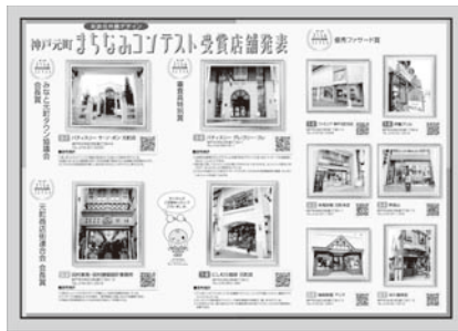
元町まちなみコンテスト