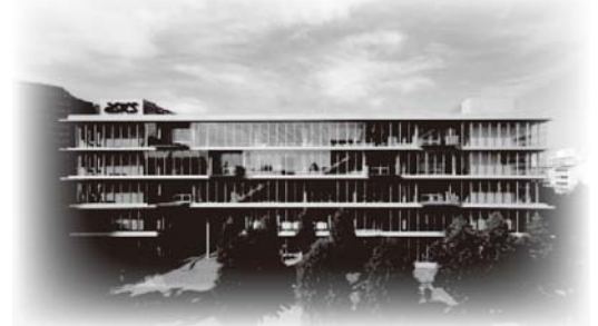
アシックス本社東館