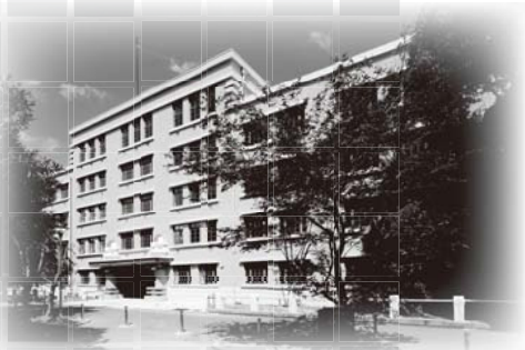
海外移住と文化の交流センター