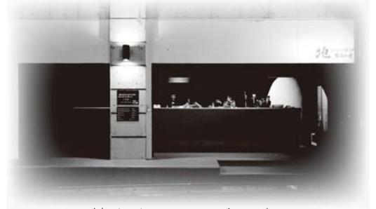
地chicken BAR ひなのや