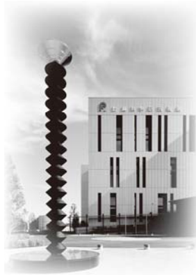
京速コンピューター「京」レセプタクル モニュメント「発展の塔」