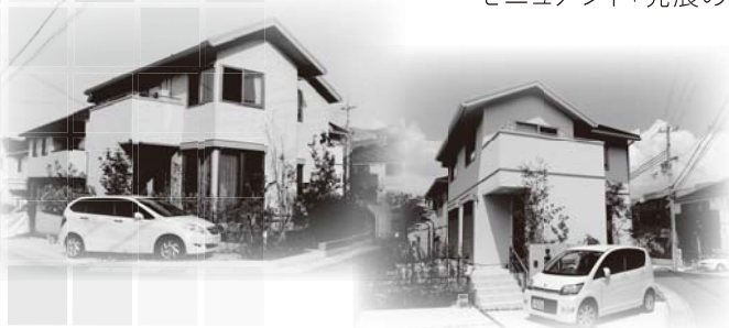
シティアンダンテ学園東町VC-4号地・VC-8号地