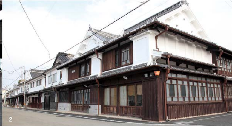
1. 郡役所跡 / 2. 八女福島 白壁の町並み / 3. 町の人々 / 4. 八女灯笼人形祭り / 5. 茨城から移住してきた梅木さん一家 / 6. 八女の上から見下ろした町並み / 7. 町並みを守る職人さん