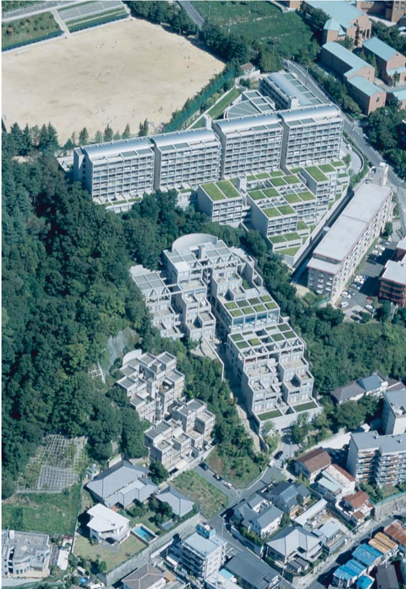
六甲の集合住宅 I, II, III

建築は、人々に活力を与えることができます。新しい建物を創造すること、あるいは古い建物を再生させることによって、過疎化し衰えつつある村、自然の災害を被った地域がふたたび立ち上がり、前に進み始めることさえあるのです。建築のもつこうした力を、建築家・安藤忠雄氏は、神戸の地を出発点に世界中で発揮してきました。昨年、フランスのレジオンドヌール勲章(コマンドゥール)を受賞された氏に、阪神・淡路大震災から20年が経とうとする今、未来へ向けた再生について語っていただきます。