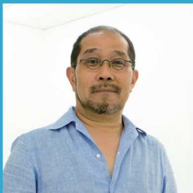
青木淳 Jun Aoki