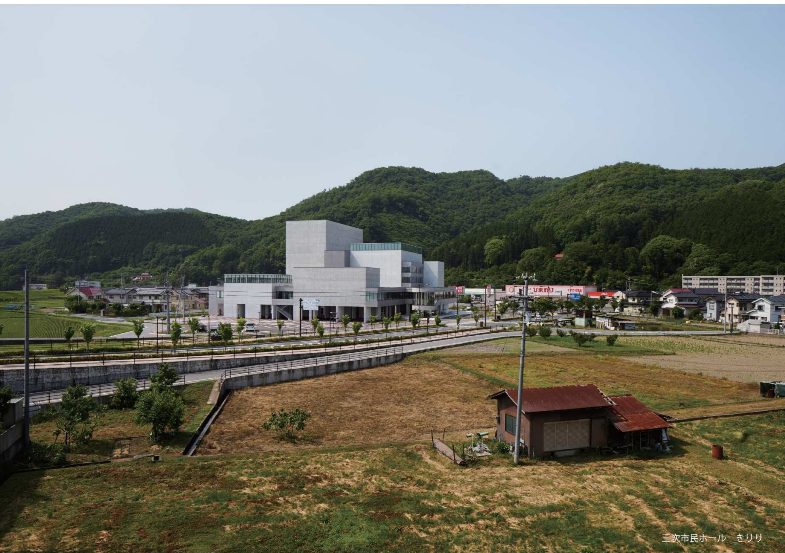
三次市民ホール きりり