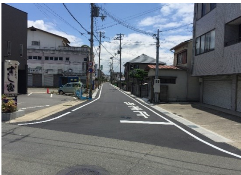
道路改修工事の完成写真 改修内容：舗装打替・ 水路改修・汚水引込改修 (公共土木工事)

私の主な業務内容は、現場に出て公共工事の現場代理人を務め、見積や積算などもしております。年々施工者にも色々な規制がかかり日々苦戦しながらも、なんとか毎日頑張っています。