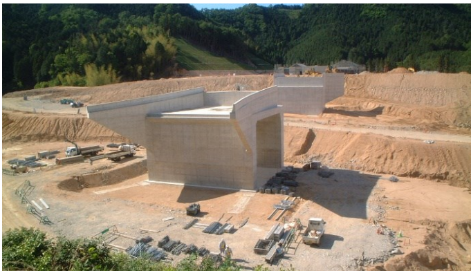
ゼネコン勤務時代の現場風景 春日和田山道路山東P A 付近 写真奥が山東P A