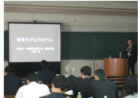
近畿あーきてくとで建築子どもプログラムについて発表した時の写真

元々土木出身なので様々なスキルを持っている建築士の方とお話出来て、仕事でも繋がったり、建築士会は無くてはならない存在となっています。 了