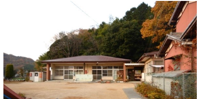
保育所の改修工事完了時の写真 改修内容：内部改修・屋根改修 (公共建築工事)

(株)小西工務店の業務内容は、公共建築や土木、民間では集合住宅や宿泊施設、福祉施設などの改修やメンテナンスや個人住宅のリフォームなどを行っています。道路改良工事や橋梁補修工事のようなインフラ維持工事も多数受注しております。最近では、橋梁に吊り足場をかけて橋台と橋の裏面を補修するような特殊な工事も実施しております。