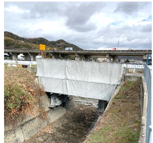
橋梁補修工事の吊り足場写真 補修内容：橋梁補修、舗装打替 (公共土木工事)