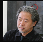
内藤廣 Hiroshi Naito 建築家・東京大学名誉教授

1950年生まれ。1976年早稲田大学大学院修士課程修了。 フェルナンド・イゲラス建築設計事務所 (スペイン・マドリッド)、 菊竹清訓建築設計事務所を経て、1981年内藤廣建築設計事務所を設立。 2001~2011年東京大学大学院にて、教授・副学長を歴任。 2007~2009年度には、グッドデザイン賞審査委員長を務める。 主な建築作品に、海の博物館 (1992)、安曇野ちひろ美術館 (1997)、 牧野富太郎記念館 (1999)、鳥根具芸術文化センター (2005)、 日向市駅 (2008)、高知駅 (2009)、虎屋京都店 (2009)、旭川駅 (2011) など。 また近著には、『NA 建築家シリーズ 03 内藤廣』(日経BP社)、 『内藤廣と若者たち 人生をめぐる一八の対話』(東京大学景観研究室編、鹿島出版会) などがある。